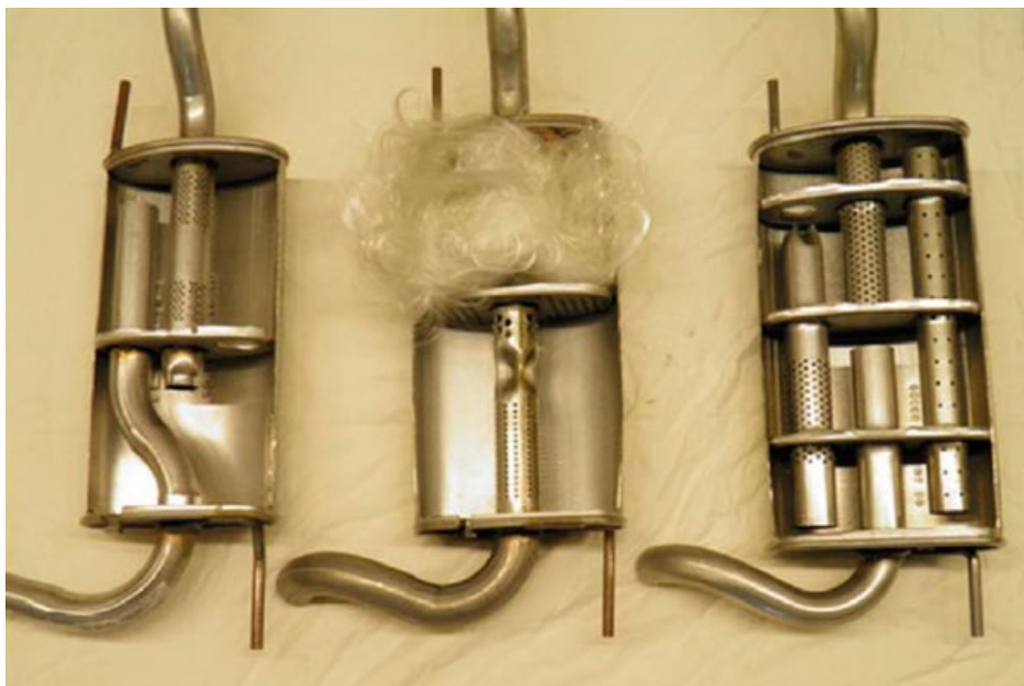
VW Polo 2001 a zadní díl od MTS (zcela vpravo) a největší prémioví konkurenti. Zde je jasně vidět, jak se dá ušetřit na nákladech na výrobu. Ovšem dostáváte za svoje peníze opravdu to co chcete?