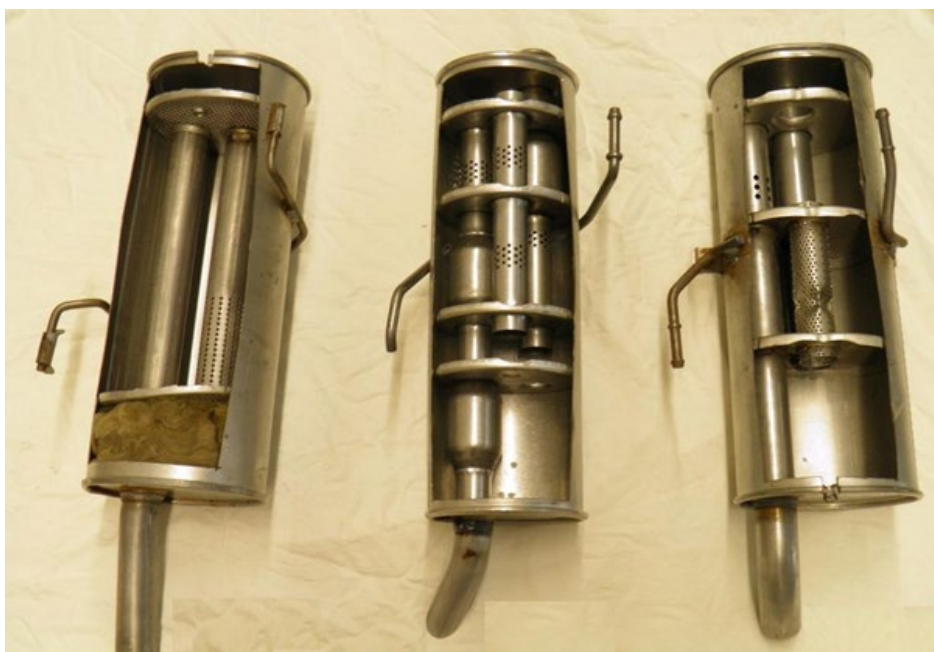
Peugeot 206 – zadní díl. I zde je patrné šetření u konkurentů (MTS uprostřed). Navíc na vzorku vlevo lze vidět pro OE zakázanou minerální vatu.