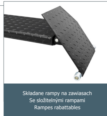
Składane rampy na zawiasach Se složitelnými rampami Rampes rabattables